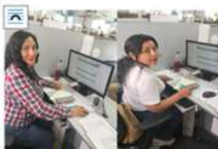
Asistentes- técnicos-¶ de-¶ UGEL-02, 04-Y-05¶