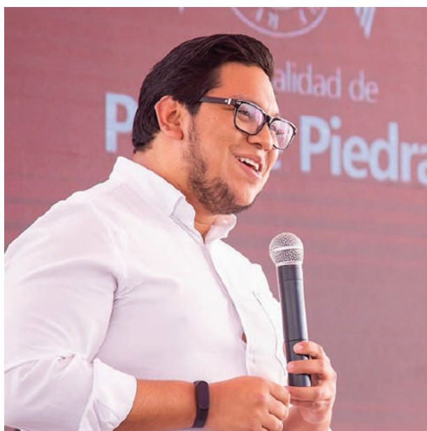
Presidente de la Mancomunidad Municipal de Lima Norte

Cabe resaltar que esta articulación municipal forma parte de otros esfuerzos de actores públicos y privados, que empujan el desarrollo integral de Lima Norte. En términos de gobernanza territorial es un aporte fundamental para concretar una nueva manera de gobernar Lima Ciudad, es el articulador y gestor del AREA INTERDISTRICTAL DE LIMA NORTE COMO INSTANCIA DE PLANIFICACION, COORDINACION Y GESTION, en el marco del Nuevo Régimen Especial para Lima Metropolitana, pedido desde años desde diversos sectores interesados en el desarrollo de Lima Ciudad, que cuenta con más del 30% de la población del país, es capital de la república, sin embargo, crece fragmentada, desarticulada, violenta y aun con varias brechas económicas y sociales.