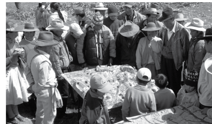
Foto: Comunidades mapean efectos del cambio climático.