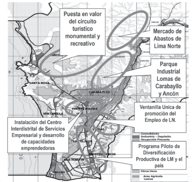
CODET : Proyectos Prioritarios para Lima Norte

Por otra parte, en el aspecto económico, como una continuidad de la experiencia del CODECON pero aprendiendo de su experiencia, se constituyó en el 2013 el CONSEJO DE DESARROLLO TERRITORIAL DE LIMA NORTE, con una participación de la Municipalidad Metropolitana, la integración de otros gremios empresariales, la participación de seis universidades y de instituciones de nivel central como PRODUCE y MINCETUR. Este espacio, junto a la Municipalidad Distrital de Carabayllo hizo incidencia para la asignación de los terrenos para el parque Industrial de Carabayllo y actualmente viene realizando acciones para el acceso a proyectos ante Programas del Gobierno Nacional.