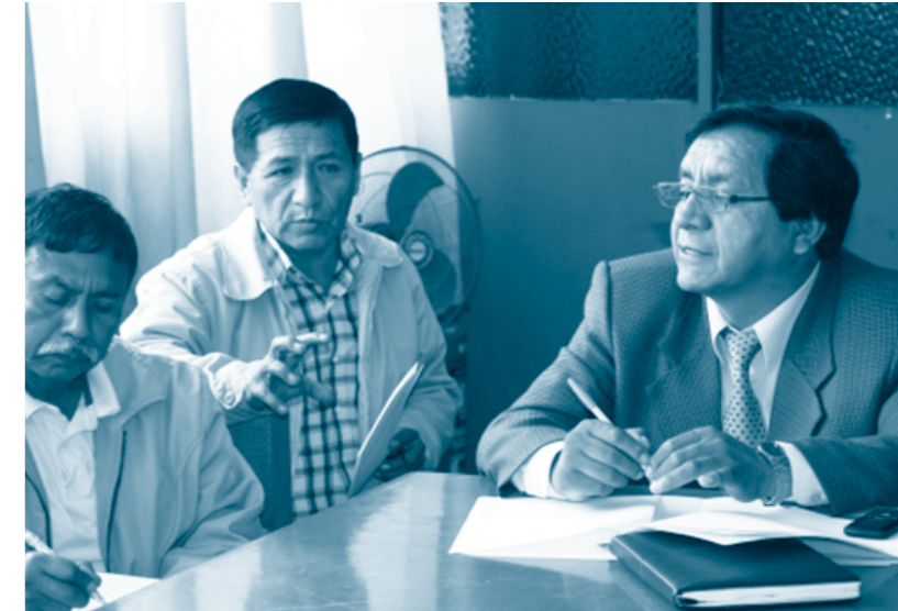
Reunión de trabajo del Grupo Impulsor.

Hay una constante que es una mirada unilateral de esta problemática, siempre se pone mucho énfasis en la cues-