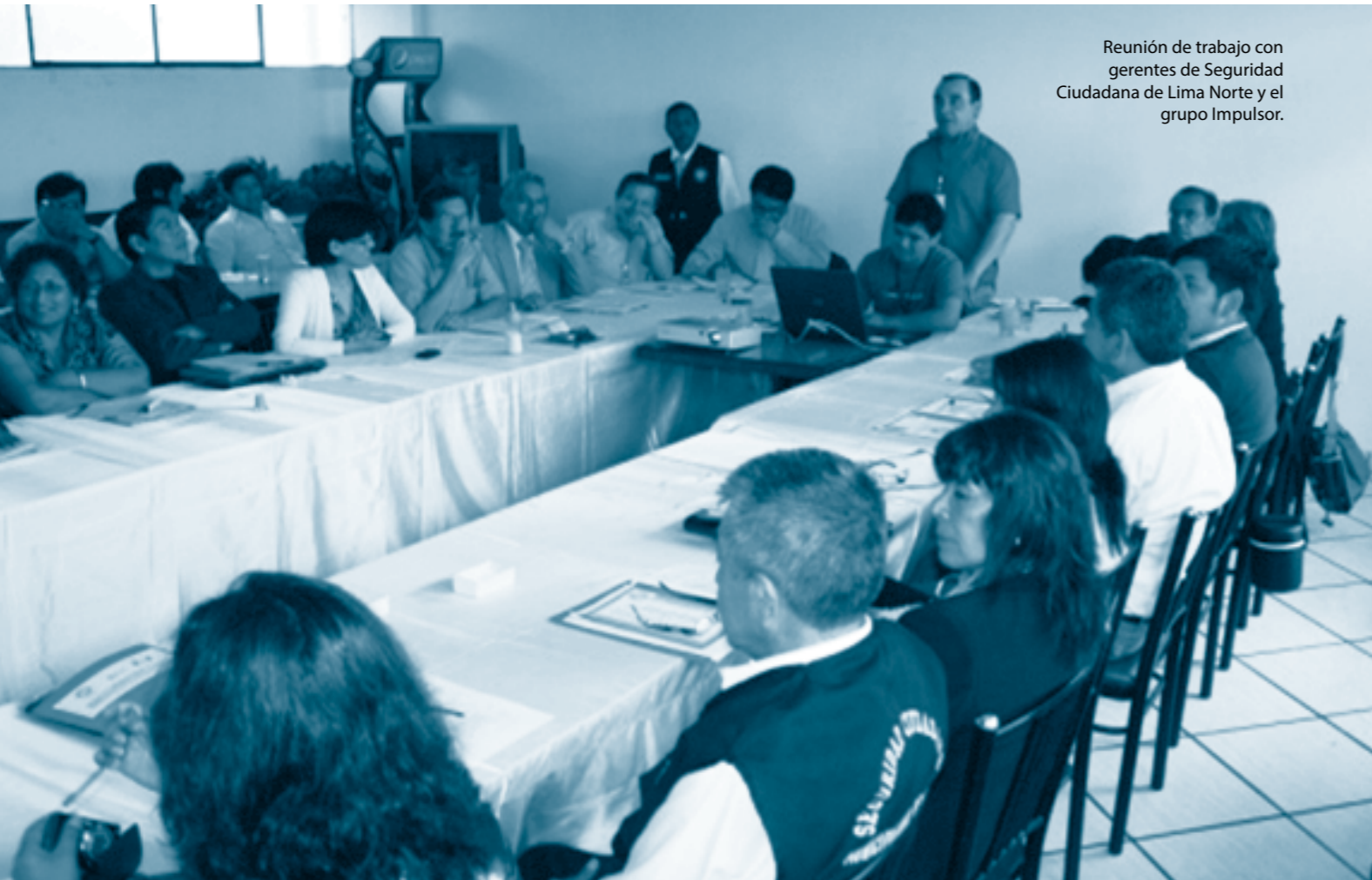
Reunión de trabajo con gerentes de Seguridad Ciudadana de Lima Norte y el grupo Impulsor.

Uno de los problemas sociales más fuertes es la inseguridad ciudadana que afectan a las actividades económicas y sociales; por tanto, se ha convertido en un factor negativo para el desarrollo integral de nuestros distritos.